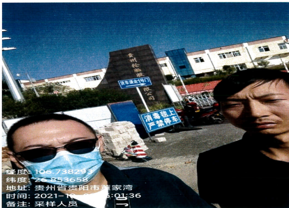
项目门头 (采样人员)