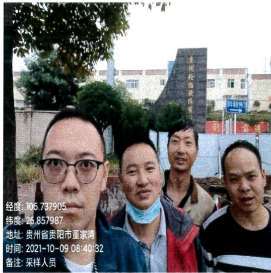
项目门头 (采样人员)